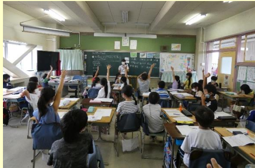
教育実習生① 3年生の理科の授業の様子です。身近な生き物と環境とのかかわりについて学習をしました。