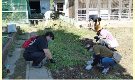
学校応援団② 本年度より、学校応援団の皆様にご協力いただき、毎週月曜日に学校の環境整備を行っております。