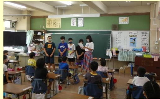
はじめましての会 1年生から6年生が各班に分かれて活動を行う「縦割り班活動」の初めての顔合わせを行いました。次は、青空ランチで一緒に活動を行います。