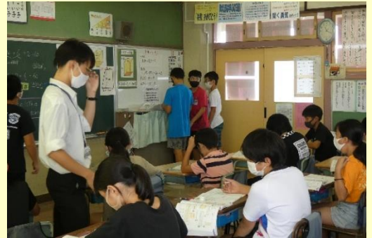
教育実習生② 6年生の算数の授業の様子です。柱体の体積の求め方について学習をしました。