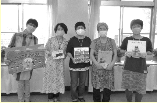
学校応援団① 9月より学校応援団の活動を再開しました。子供たちが楽しみに待っていた読み聞かせも再開しました。